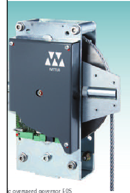
Electronic speed governor EOS Elektronischer Geschwindigkeitsbegrenzer EOS